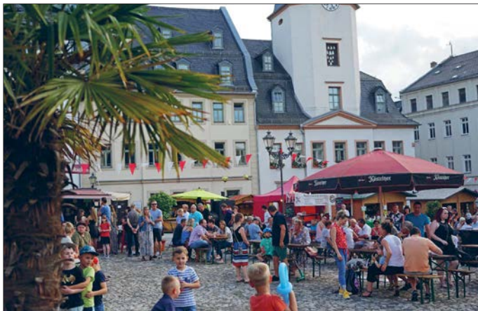
Streetfood – Genuss – Regionales: Zahlreiche Besucher nutzten dafür das Angebot am letzten Juni-Wochenende.