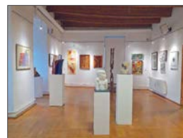
Galerieansicht, Foto: K. Zierold

Öffnungszeiten Galerie art gluchowe, Schloss Forderglauchau: