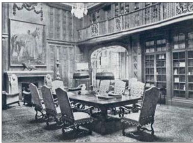
Die historische Aufnahme zeigt die Bibliothek um 1918 mit dem einstigen Gemälde.