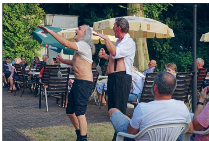
Im Theatergarten erlebten die Besucher die Gaenglbaend sowie Shakespeare à la carte (Bild).