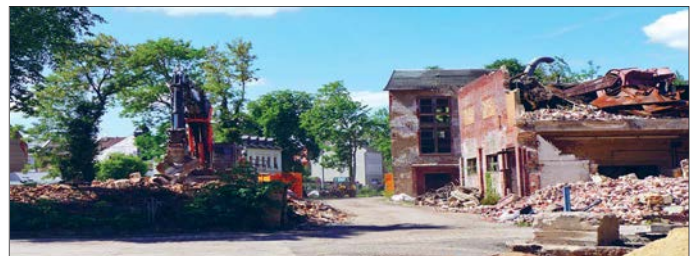
Abbruch der Brachen an der Wilhelmstraße, Foto: Stadt Glauchau

Diese Maßnahme wird mitfinanziert durch Steuermittel auf der Grundlage des vom Sächsischen Landtag beschlossenen Haushaltes.