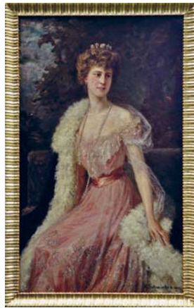
Das restaurierte Gemälde zeigt die Ehefrau und spätere Witwe des Fürsten Otto Victor II. von Schönburg-Waldenburg, Eleonore, eine geborene Prinzessin zu Sayn-Wittgenstein-Berleburg, und ist nun in ihrem ehemaligen Schreibzimmer ausgestellt. Zum einstigen Interieur gehören auch ein Armlehnstuhl sowie ein Standspiegel, die die Präsentation ergänzen.

Das Ensemble in der Bibliothek wird durch die japanische Bronzeplastik eines Tigers auf dem Kaminsims komplettiert, der sich ebenfalls ursprünglich hier befand.