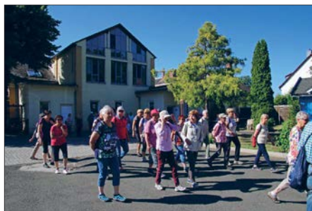
Kurz nach 9:00 Uhr brachen die Teilnehmer der Seniorenwanderung auf.

Wanderfreunden in der Begegnungsstätte der Volkssolidarität. Alle waren sich einig: Es war ein toller Wandertag für Anfänger und Erfahrene.