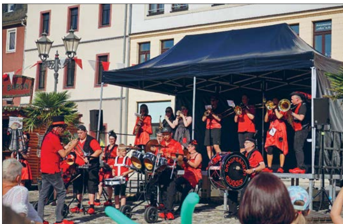
Die Draufgänger Guggis aus Meerane sorgten am Freitag und Samstag beim Genussmarkt für Unterhaltung.

Die Veranstaltung war ein gelungenes, buntes, kulinarisches Fest für alle Besucher.