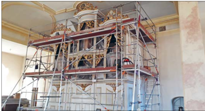
Restaurierung der Orgel, Foto: G. Schmiedel

Karten erhalten Sie für 6 Euro an der Abendkasse.