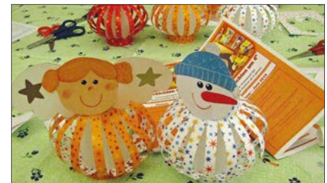
Weihnachtliches basteln.

Fast 40 Kinder drängten sich eng aneinander, um gemeinsam mit Vorlesepatin Ursula Jänsch die Geschichte „Weihnachten im Wichtelwald“ zu erleben. Anschließend waren die begleitenden Eltern und Großeltern gefragt, um gemeinsam mit den Kindern noch kleine Weihnachtsgeschenke im Lesesaal zu basteln. Mit einem abwechslungsreichen Programm für Kinder lädt die Stadt- und Kreisbibliothek Glauchau auch im neuen Jahr zum Besuch ein und freut sich über zahlreiche kleine und große Besucher!