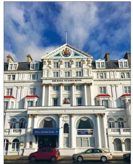
The Royal Victoria Hotel in Hastings