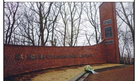
Mahnmal im Schillerpark