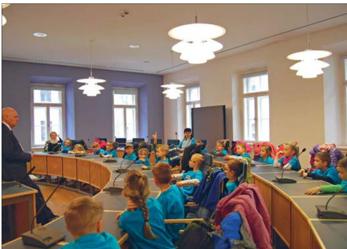
Geduldig und mit der nötigen Zeit stellte sich der Oberbürgermeister den zahlreichen Fragen der Kita-Kinder.

Die angehenden Erstklässler hatten viele Fragen an ihren Gastgeber mitgebracht. Besonders interessant fanden die Vorschüler aber die im Ratssaal vorhandene Technik und so durften sie auch einmal die Mikrofonanlage nutzen.