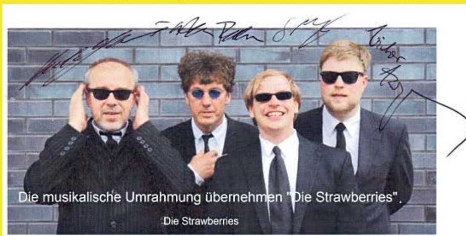
Die musikalische Umrahmung übernehmen "Die Strawberries".