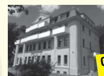
Chemnitzer Straße 3

34 1-Raum-Whg. 30 qm, 3 WE mit 2 Räumen, Bad, Balkon, Küche/ Kochnische, Gemeinschaftsraum