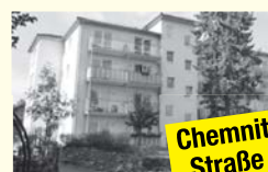
Chemnitzer Straße 1b

Tagespflege, 26 2-Raum WE Bad, Küche/Kochnische, Balkon, Gemeinschaftsraum