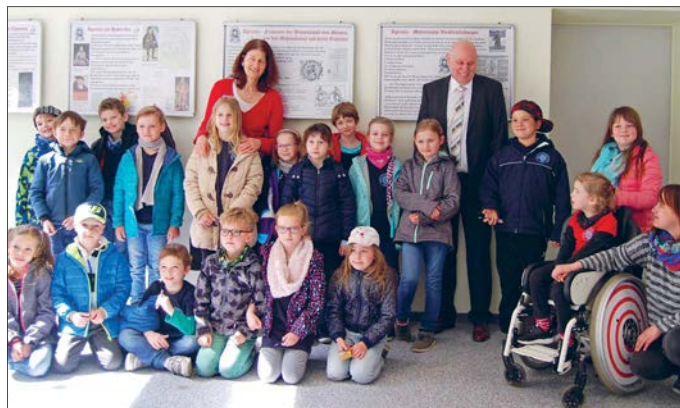
„Zum Fototermin“ hieß es für die Grundschüler, die sich zusammen mit dem Oberbürgermeister ablichten lassen konnten.

Einen seltenen Blick durften die Jungen und Mädchen zum Abschluss in das Arbeitszimmer und den Schreibtisch des Stadtchefs werfen und zur Erinnerung ein kleines Präsent mit nach Hause nehmen. □