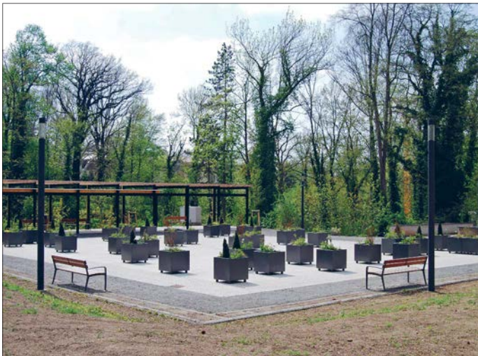
Schlossvorplatz (Foto) und Hirschgrabenbrücke stehen im Fokus der Besichtigung.

Auch ein Ausblick auf zukünftige Baumaßnahmen, die im Förderzeitraum bis 2025 noch geplant sind, ist vorgesehen. □