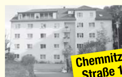
Chemnitzer Straße 1a

Tagespflege, 26 2-Raum WE Bad, Küche/Kochnische, Balkon, Gemeinschaftsraum