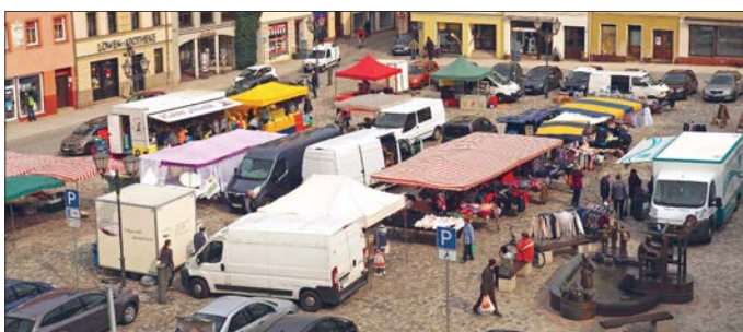
Der Glauchauer Wochenmarkt, Foto: S. Weidauer

1990 übernahm die Dresdener Niederlassung der Deutschen Marktgilde eG den