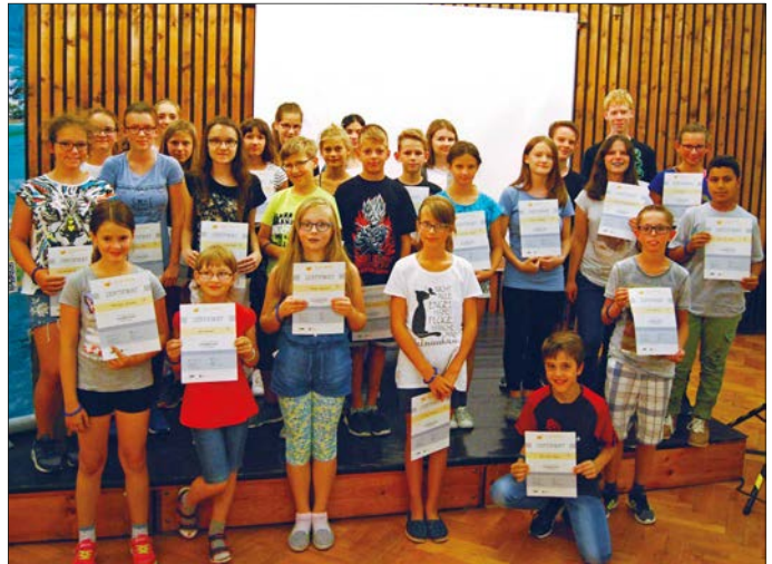
Stolz präsentierten die Glauchauer Schüler ihre Zertifikate.

Ihnen und allen anderen, die in den sechs Wochen mindestens drei Bücher schafften, wurden am Ende die wohl verdienten Urkunden überreicht. □