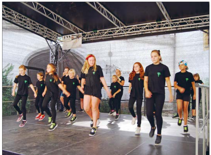
Das Jump-Team Glauchau sorgte für den passenden Einstieg für die Abschlussveranstaltung.