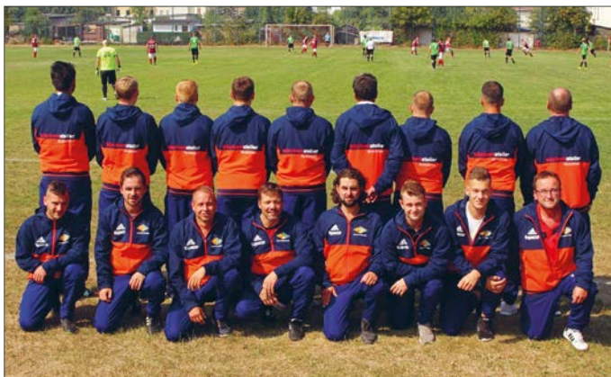
Die Mannschaft des SV Fortschritt Glauchau, Foto: Matthias Krüger