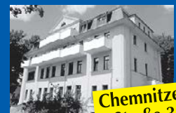
Chemnitzer Straße 3

34 1-Raum-Whg 30 qm, 3 WE mit 2 Räumen, Bad, Balkon, Küche/Kochnische, Gemeinschaftsraum, Tagespflege