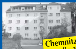
Chemnitzer Straße 1a

26 WE mit 2 Räumen, Bad, Küche/Kochnische, Balkon, Gemeinschaftsraum, Tagespflege