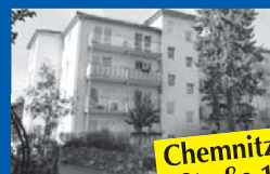
Chemnitzer Straße 1b

26 WE mit 2 Räumen, Bad, Küche/Kochnische, Balkon, Gemeinschaftsraum, Tagespflege