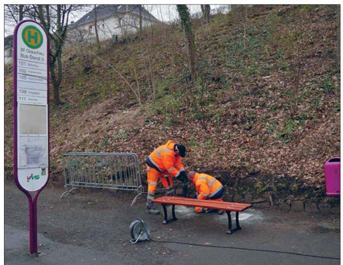
Bahnhofsmitarbeiter beim Aufstellen einer Sitzbank.