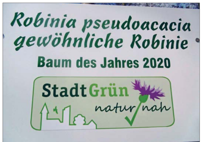
Die Robinie hat ein entsprechendes Hinweisschild erhalten.

Häufig findet sich das Holz des Baumes des Jahres 2020 heute auf Kinderspielflächen. Dort wird es bei der Konstruktion von Klettergerüsten und Spielgeräten eingesetzt.