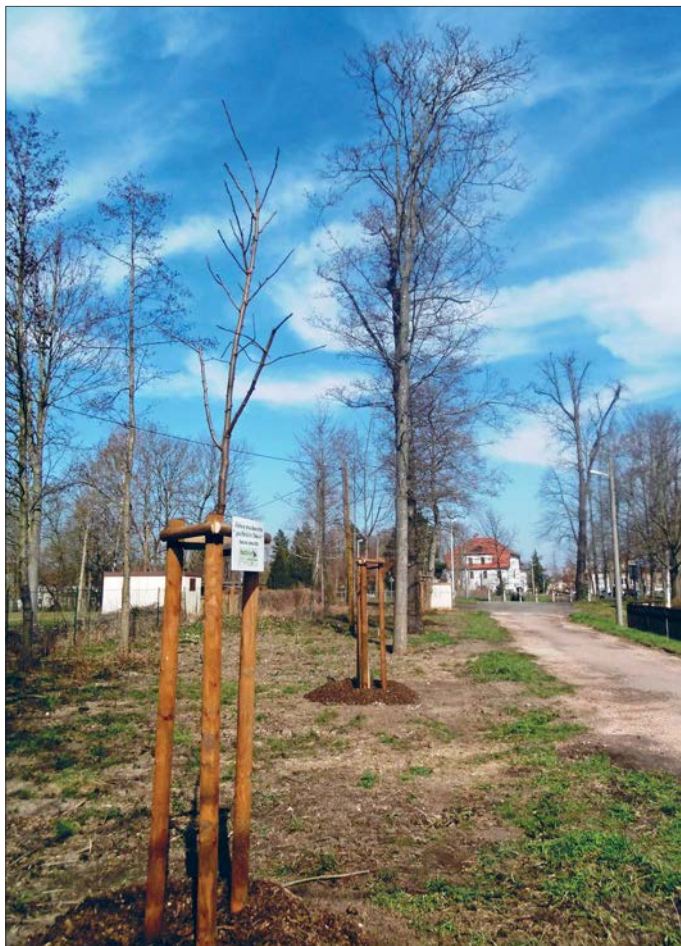
Am Wehrgarten stehen vier neue Bäume, darunter eine Robinie.

Die Echte Akazie, auch Mosesdorn genannt, ist ebenfalls ein Strauch aus der Familie der Hülsenfrüchtler. Wie die Robinie ist aber auch die Echte Akazie eine eigenständige Pflanzenart.