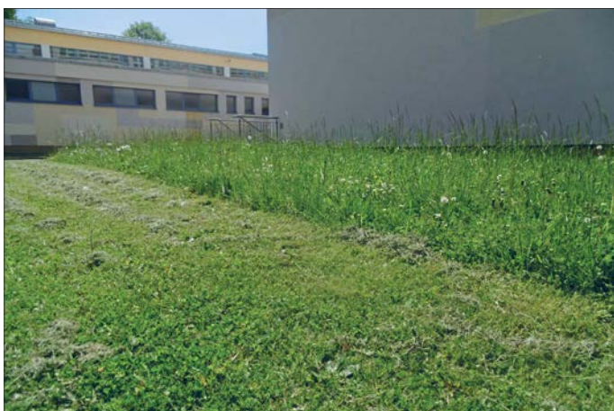
Teilmahd der Wiese an der Grundschule Rosarium

Diese Schnittmethode kommt im Stadtgebiet Glauchau bei der Pflege des öffentlichen Grüns auf den naturnahen Flächen, wie im Gründelpark, am Radweg Röhrensteig, im Carolapark, am Karlsweg und in der Bergstraße Niederlungwitz zur Anwendung. Es werden nur Wegrandbereiche regelmäßig gemäht, damit die Wege frei sind. Die restliche Fläche wird in Bereiche eingeteilt, die zeitversetzt zu unterschiedlichen Zeiten gemäht werden. So bleibt immer ein Nahrungs- und Lebensraumangebot für die Insekten erhalten. Ein Teil der Flächen bleibt sogar über den Winter stehen und wird erst Ende März gemäht. Das hat den Vorteil, dass Schmetterlingspuppen über den Winter kommen.