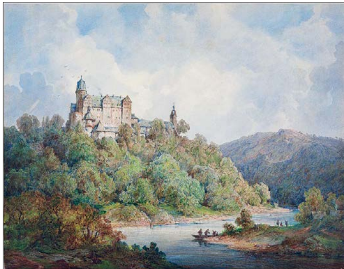
Schloss Rochsburg, Wilhelm Gebhardt, 1867, Aquarell

Anlässlich des Internationalen Museumstages, der am 17. Mai begangen wurde, blickt die Einrichtung in diesem Jahr in unsere Heimat und lädt mit der Sonderausstellung „STADT – LAND – FLUSS“ auf eine Reise entlang der Zwickauer Mulde ein.