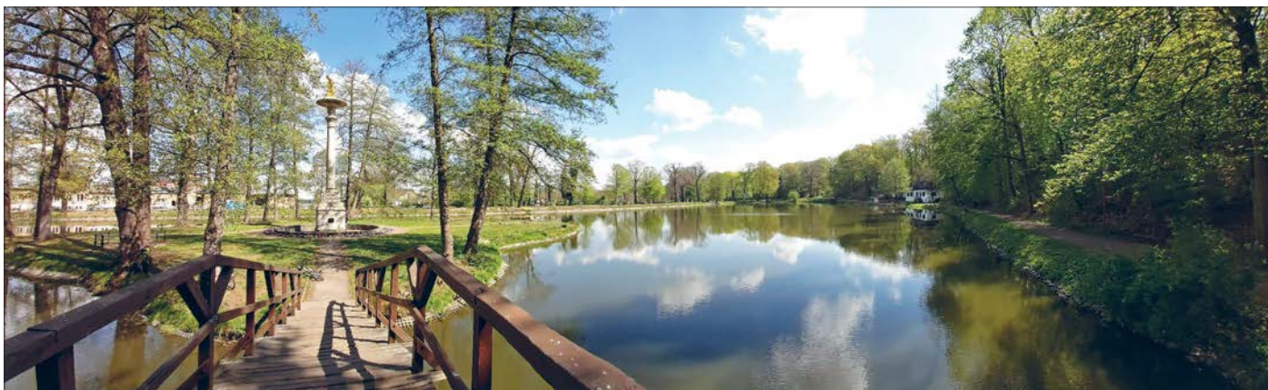
Der Gründelpark ist mit 67.500 qm die größte innerstädtische Parkanlage. Kernstück ist der Gründelteich mit erschlossener Insel.