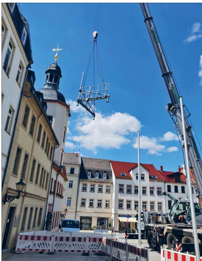
Mithilfe eines Krans erfolgten die Installationsarbeiten für die Errichtung einer Funkantenne auf dem Rathaus.