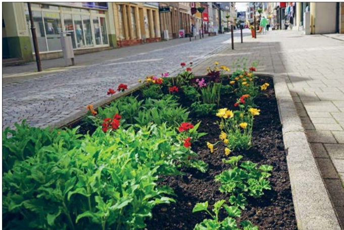
In der Leipziger Straße (Fußgängerzone) sind die Hochbeete neu bepflanzt worden.

Auch die Schmuckbeete wurden bestückt. Diese sind im Bürgerpark, im Bahnhofspark, am Stadttheater, vor dem ehemaligen Kreisgericht am Heinrichshof und auf der Insel im Gründelpark zu finden.