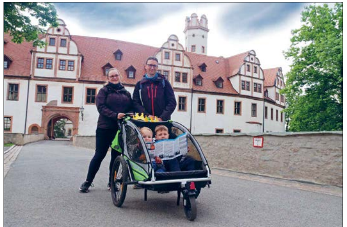
Geocachingtouren sind auch als Familienausflug, wie hier zum 1. Geocachingaktionstag vor einem Jahr, geeignet.