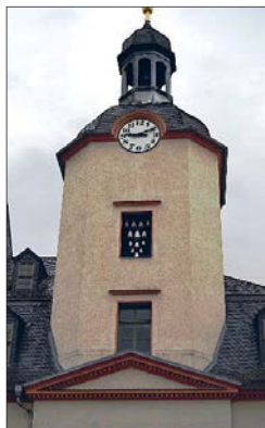
Glockenspiel im Rathausurm

18:05 Uhr „Der Mond ist aufgegangen“ (Melodie Johann Peter Abraham Schulz, 1790)